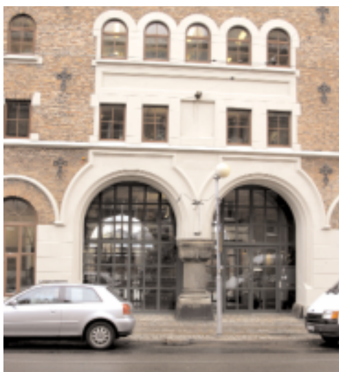
HÄR INNE I MILJÖFÖRVALTNINGENS LOKALER PÅ KARL JOHANSGATAN 23-25 KOMMER TIDSKAPSELN ATT FÖRVARAS TILL ÅR 2050

Om 46 år får alla som kan vara med veta hur vi som lever 2004 trodde att livet skulle bli i mitten av seklet. Kanske kommer de att förvånas över hur framsynta vi var. Eller småle åt vår aningslöshet.